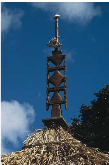
Flèche faïtière de case traditionnelle à Canala (région xârâcùù, sur la côte est)

Arts Kanak, Roger BOULAY, Ed. Grain de Sable, 2004.